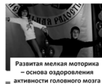
Развитая мелкая моторика — основа оздоровления активности головного мозга