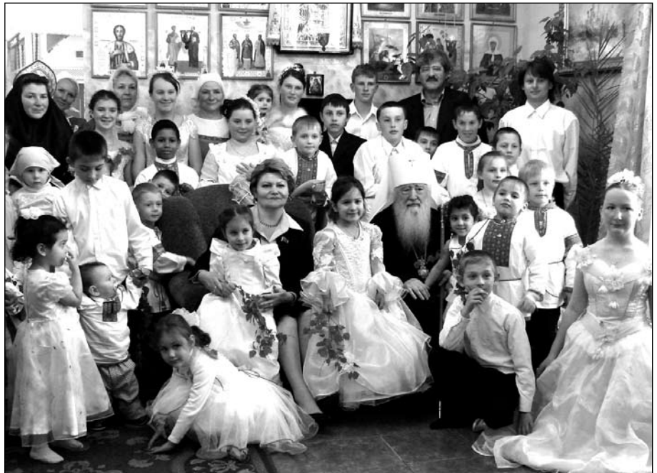
Встреча с Митрополитом навсегда останется в памяти

Я считаю, что в этом отношении у нас сейчас все же много перегибов.