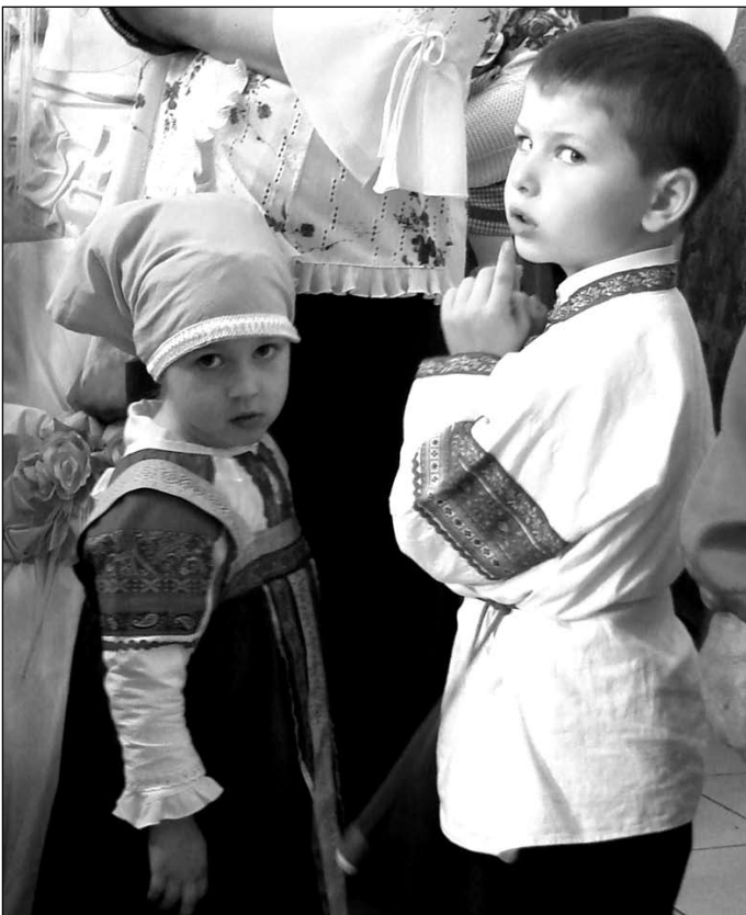
В Никитском храме всегда много детей