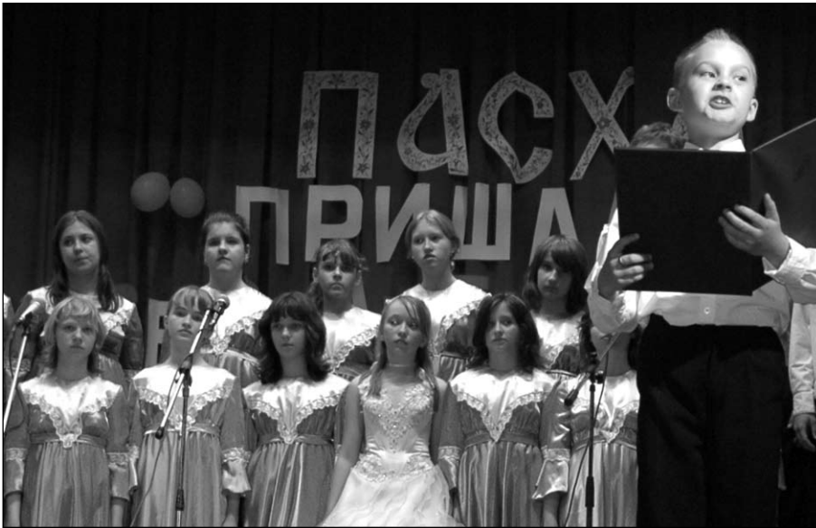
Концерт в Доме культуры Цементник

На каждом приходе в Коломенском церковном округе праздник Светлого Христова Воскресения стремятся встретить широко и торжественно, чтобы разделить пасхальную радость со всеми пришедшими в этот день в храм прихожанами и гостями.