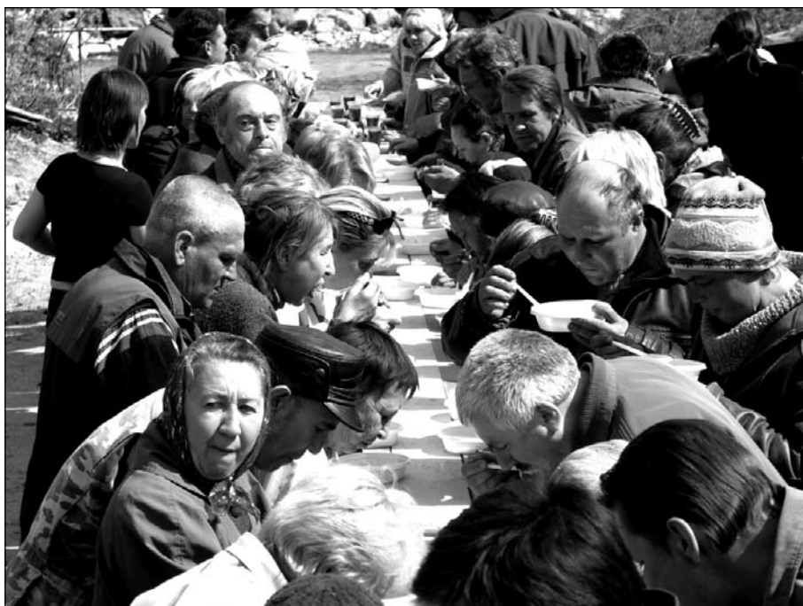
Пасхальная трапеза для малоимущих

Но самое главное — частичку любви и заботы.