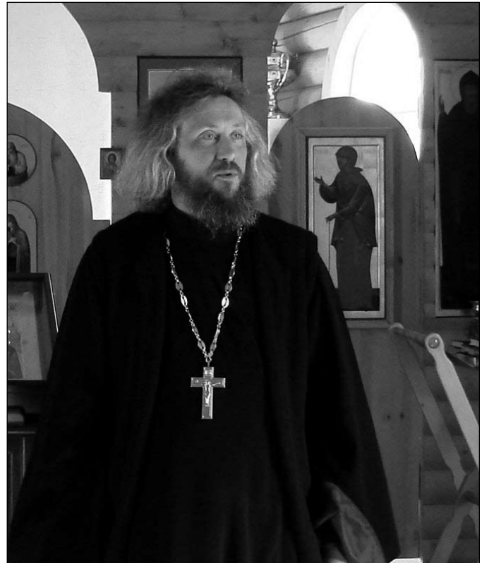
Богослужения здесь совершаются регулярно

По своему восприятию мира по уровню развития они как дети: это умственно отсталые люди, или интеллектуально сохранные, но страдающие ДЦП и другими тяжелыми патологиями. Среди них есть и такие, которые в известных условиях