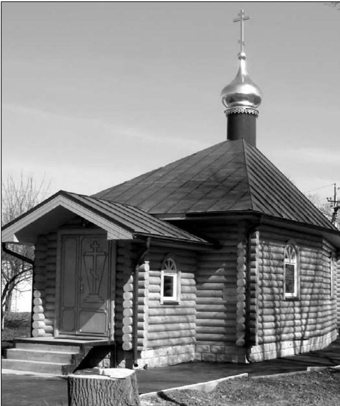
Церковь в честь Казанской иконы Божией Матери

Есть в интернате и такие, которые при известных условиях могли бы жить в семьях, и развитие их было бы в таком случае значительно выше. Отклонения могли бы быть фактически незаметными. Вот такие и помогали, и для прихода какие-то работы выполняли.