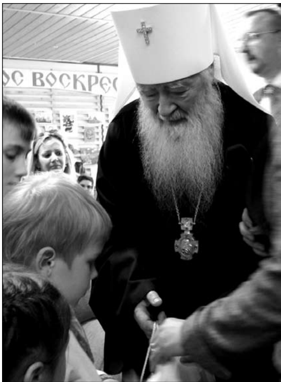
Каждый ребенок получил подарок

Минскому шоссе, взявшись за руки... И вот привезли их в приют... Когда я туда приехала, они убрали территорию. Так он ее и там сопровождает, так за ручку и держит. Представляете, какая забота! Он сам еще маленький, но он и сейчас несет ответственность за свою сестричку.