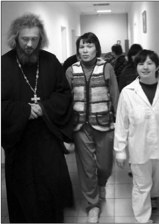
Приезд священника — радость для всех

объяснить, кому-то рассказать. Но Христос, Пасха Христова, Рождество — для них это все имеет важный смысл. Никто их ничему такому не учил, но они изначально уже имеют какое-то понимание.