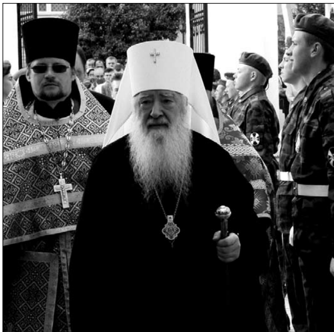
Торжественная встреча Митрополита

— Пятнадцать лет назад возродился из руин храм, в котором сегодня отмечается 355-летие со дня основания храма