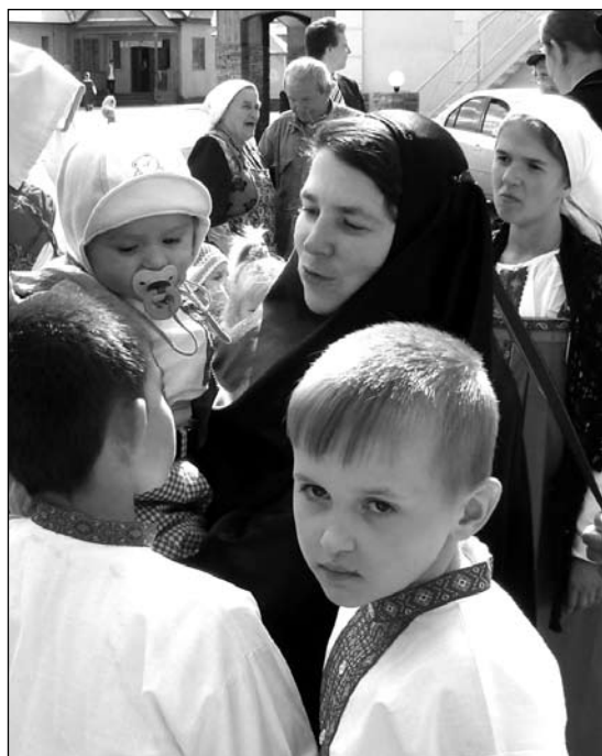
Во дворе приюта «Никита»

— Ну, без трудностей, наверное, никогда ничего не бывает. Кстати, возможно, именно благодаря тому, что он постоянно об этих трудностях говорил на всех уровнях, приют и стал сегодня таким, каким мы его видим. И еще очень важно, что у детей этого приюта есть хорошие покровители и друзья — в лице нашего уважаемого владыки Ювеналия, Губернатора Бориса Всеволодовича Громова, Правительства Московской области. Конечно, это здорово, что сейчас есть такая возможность — создавать приюты при храмах.