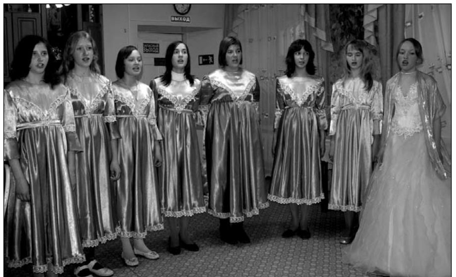
Выступление в доме престарелых

В завершение праздника всем гостям небольшие памятные подарки и букеты гвоздик.