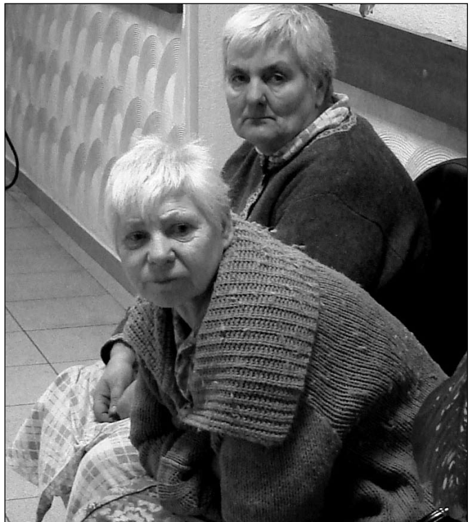
Они живут в интернате до конца своих дней

Что удивительно, это их чувство, именно понимание того, что происходит в Церкви. Они не могут все