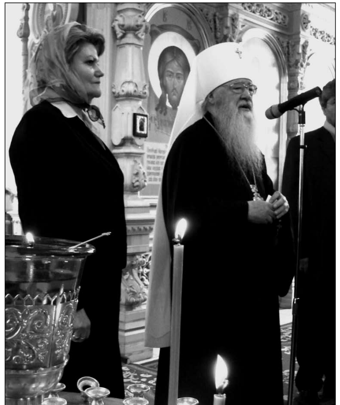
Приветственное слово Митрополита