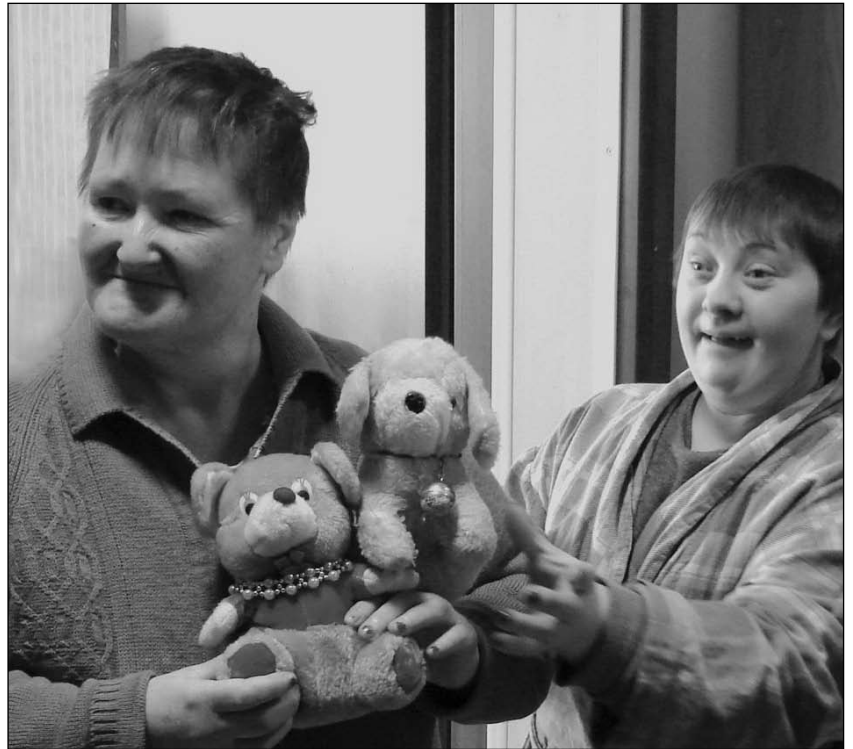
Доброта везде в цене

объяснить, кому-то рассказать. Но Христос, Пасха Христова, Рождество — для них это все имеет важный смысл. Никто их ничему такому не учил, но они изначально уже имеют какое-то понимание.