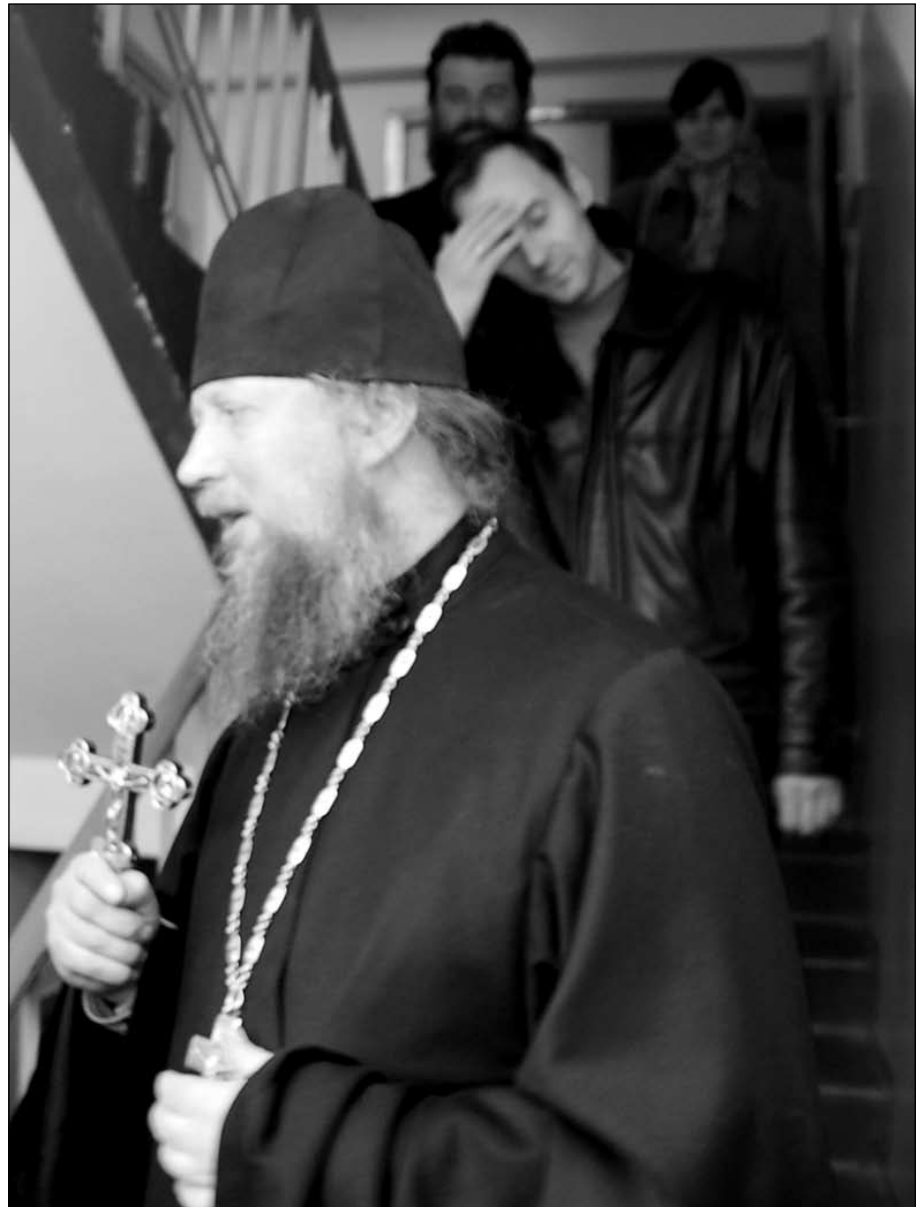
Посещение интерната не всем дается легко...

Это, конечно, сложный вопрос, никто не говорит, что это все легко! Нельзя дать какие-то общие рецепты на все случаи. Но в каждом конкретном случае можно найти какие-то варианты: привлечь родственников, знакомых, нанять нянечку, которая будет смотреть... Я не могу за всех решить, но стремление такое обязательно должно быть. Все-таки из родного дома — родных родителей!.. Избави нас Господи от этого!