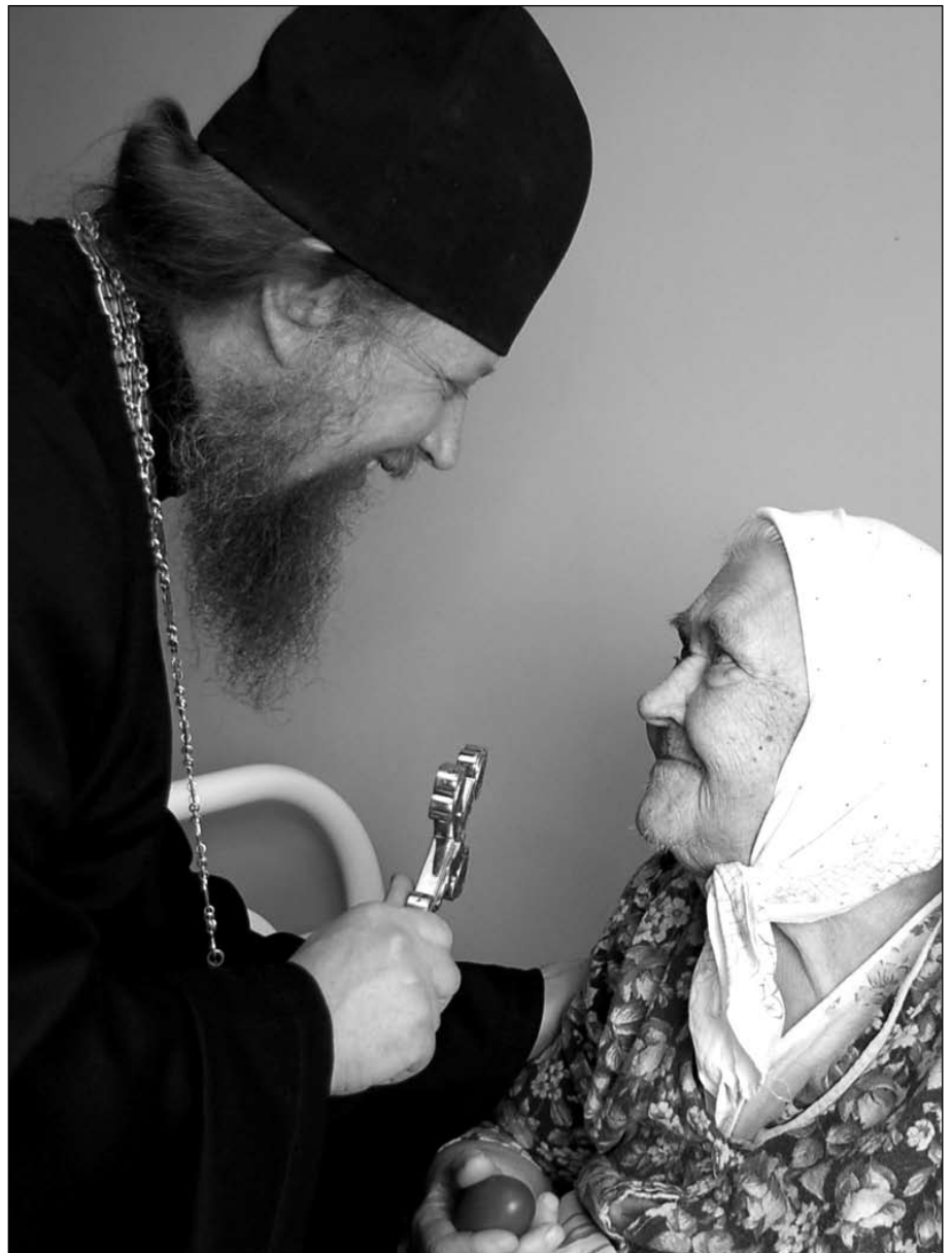
Вера помогает в немощи

Они там являются труждающими, то есть выполняют самую тяжелую