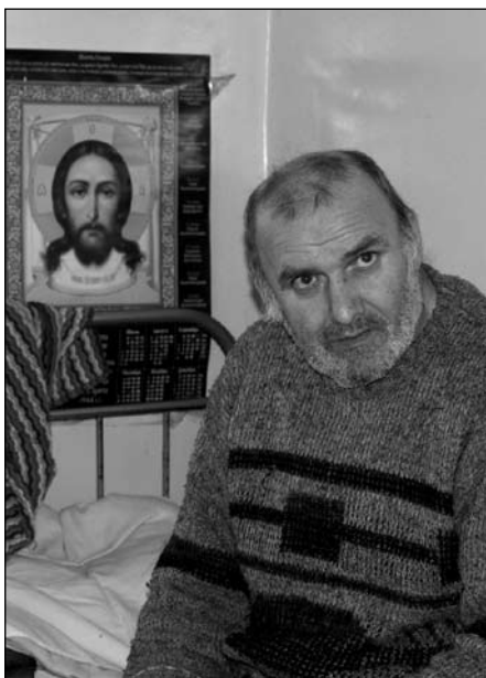
Счастье — жить с Господом

работу, когда бабушек нужно перевернуть с боку на бок, поменять им белье. Бабушки и грузные бывают, тяжелые: попробуй-ка ее подними, сними с нее все, а потом еще и назад положи! С этим может справиться только очень крепкий мужчина или крепкая женщина.