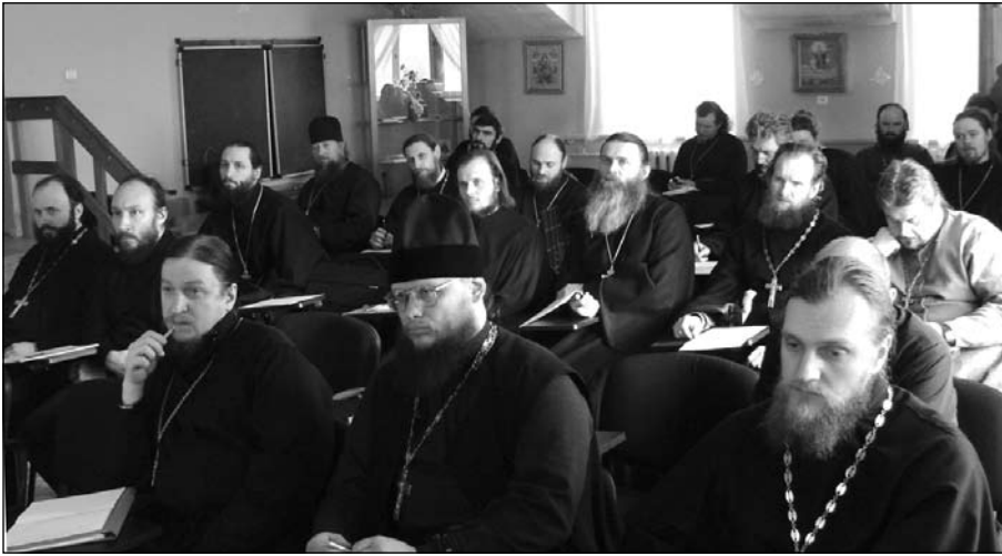
Собрание епархиального отдела

На собрании Епархиального отдела по социальному служению и благотворительности, которое прошло в храме Владимирской иконы Божией Матери в г. Мытищи, встретились ответственные по социальной работе в церковных округах.