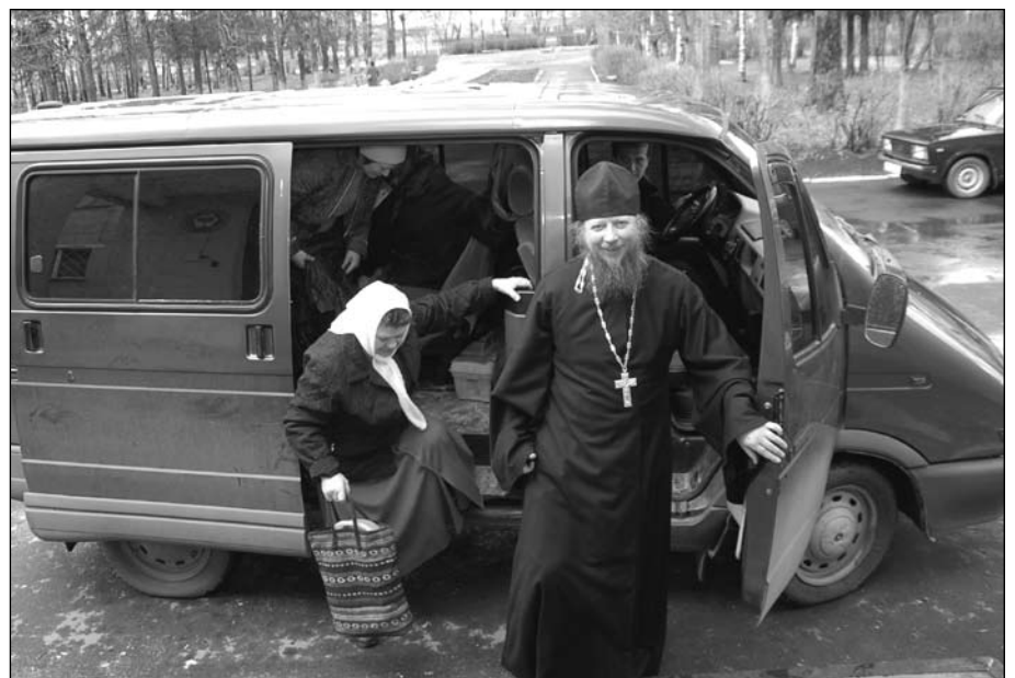
Очередной визит прихожан