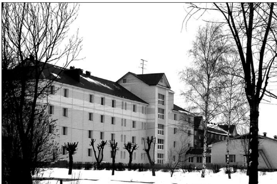
Реконструированный корпус для инвалидов-колясочников Климовского дома-интерната

И вот это переживание, благодарность Богу за все, должно быть нам присуще во все дни наши и в любых обстоятельствах.