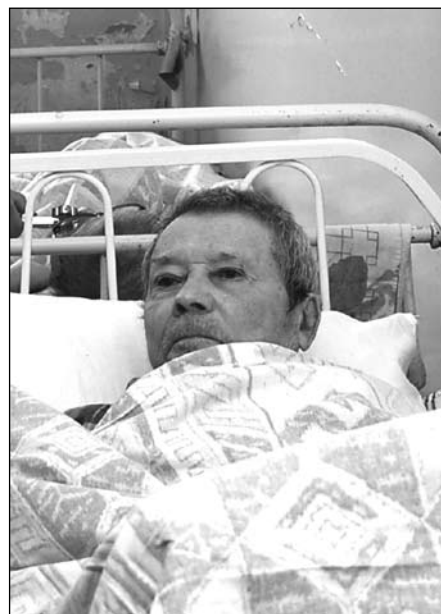
Молитва и покаяние даруют надежду

— Нынешнее благополучное финансовое положение дает свои плоды. Буквально в прошлом году был завершен ремонт соседнего корпуса для инвалидов-колясочников. Теперь это минимум трехзвездочный отель. Там палаты на двоих, в каждой палате жидкокристаллический телевизор, никелированная сантехника, индивидуальный туалет на двоих, холодильник. В корпусе