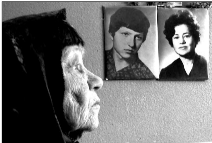
Если бы молодость смела, если бы старость могла...

В 4-м корпусе, где собраны лежащие парализованные люди, которых на богослужение собрать невозможно, осуществляется