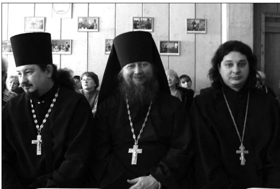
В зрительном зале – почетные гости

Концерт уже начался. Ребята поют песни военных лет, те песни, которые согревали людей в невыносимых фронтовых условиях, придавали силы и вели в бой. Сегодня эти неокрепшие души, в свою очередь, столкнулись с невыносимыми условиями, нечеловеческой жестокостью, им еще предстоит выдержать бой со злом. И главную помощь и поддержку может оказать им в этом всемилостивый Господь и заступничество Пресвятой Богородицы со всеми святыми. Они теперь об этом знают. Важно, чтобы ребята это хорошо поняли и запомнили на всю жизнь.