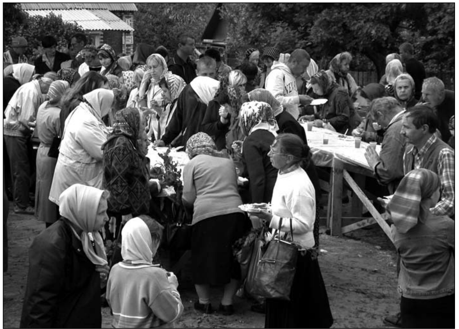
За общим столом собирается до тысячи человек. Коломенское благочиние

В храме организована также переписка с людьми, находящимися в местах лишения свободы. Им мы регулярно по-