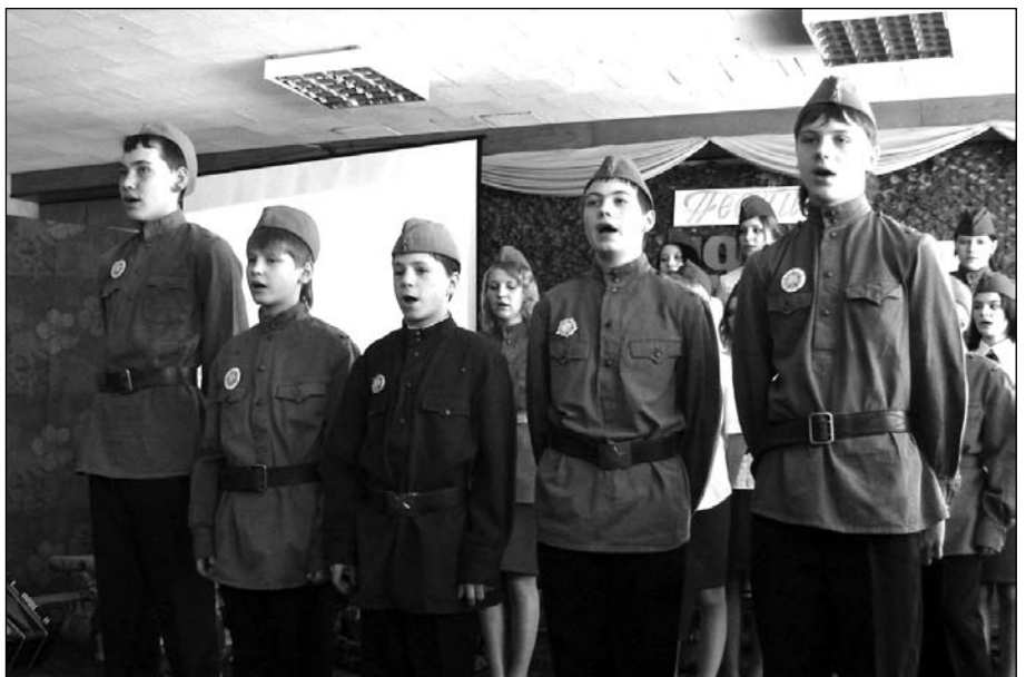
Концерт в «Радуге»

А некоторые дети говорили: «Мы хотим креститься». Но здесь требуется учить волю родителей. Одна мать крещение откладывала. Но упорно говорила: «Нет, я сама их окрещу, потому что я хочу выбрать крестную».