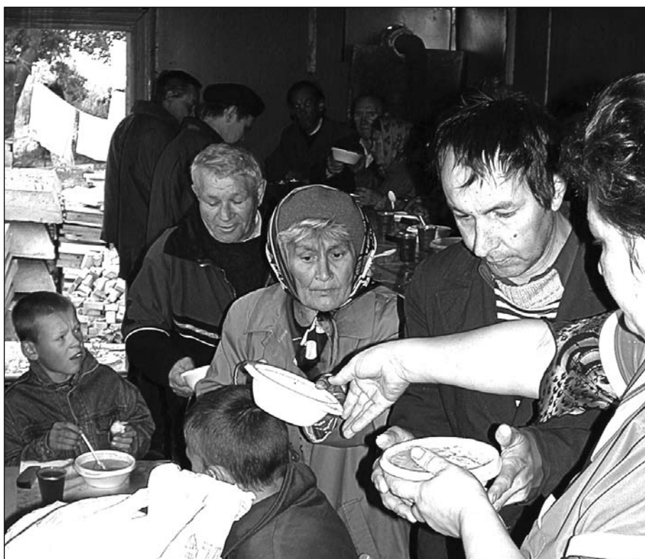
Благотворительная столовая в Коломенском благочинии

— Статей расходов несколько. При храме работает благотворительная столовая, в которой ежедневно получают горячий обед более пятидесяти малоимущих. Около сорока семей получают пищу на дом — это еще порядка 150 порций.