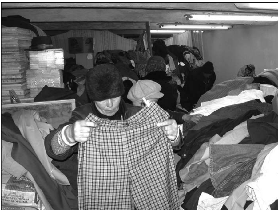
Раздача одежды при Троицком храме п. Шурово