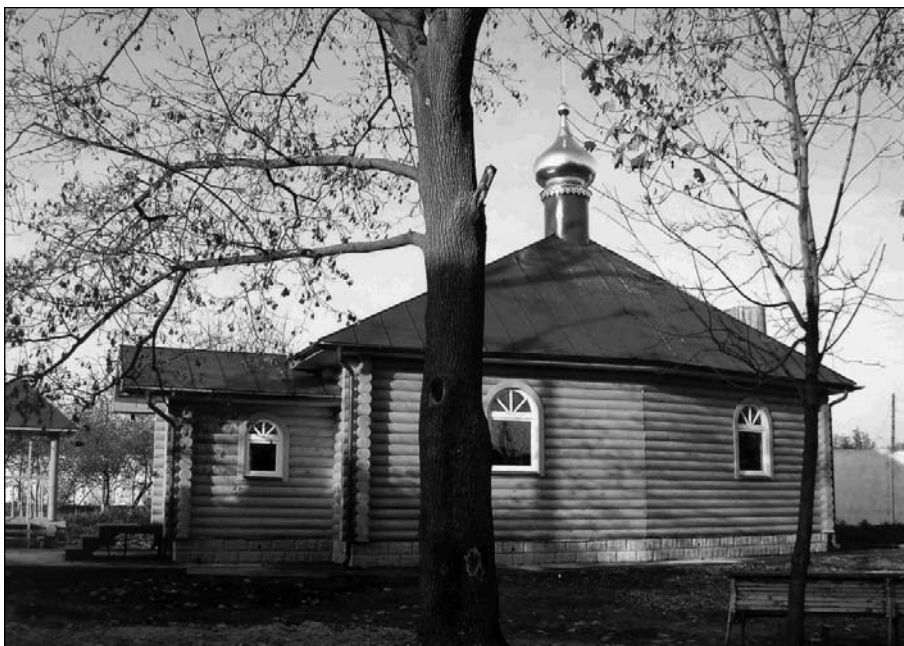
Казанская церковь в селе Остров