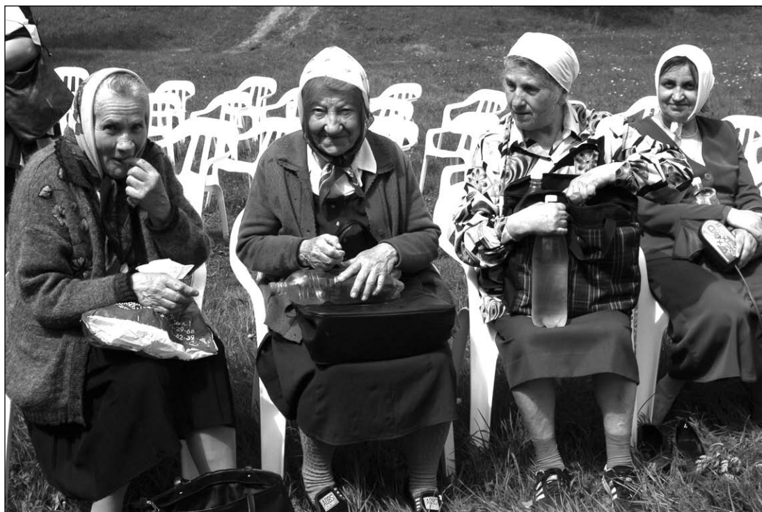
Жизнь радует в любом возрасте