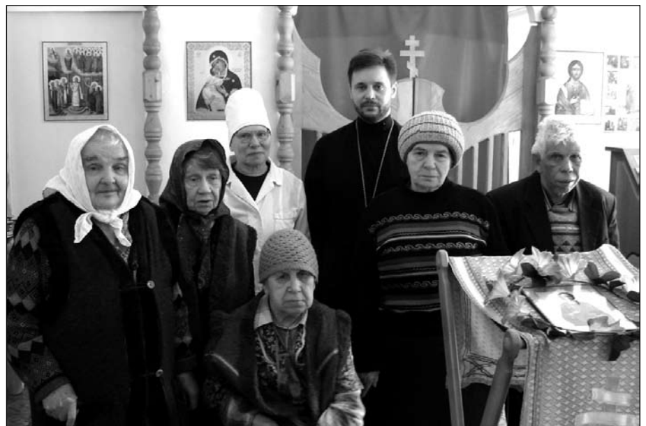
Прихожане и настоятель домово́й церкви